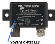
Voyant d'état LED