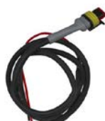
Câble de contrôle pour Cyrix-ct 12/24-230 Longueur : 1 m